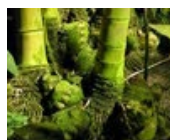
BAMBÚ, BREZO, ESPALDERAS, FLOWER STICK Y TUTORES